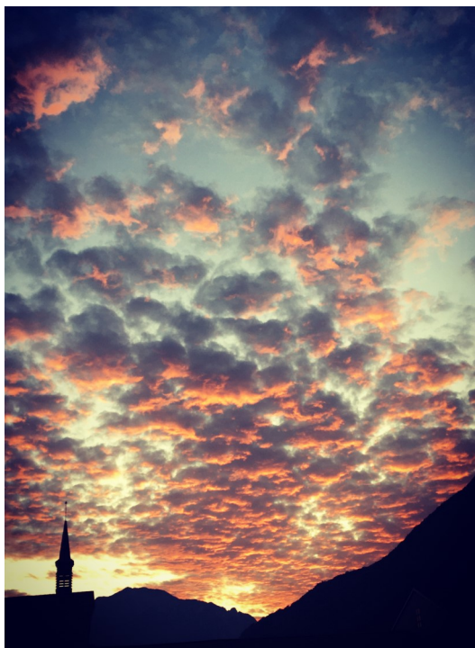
Ciel de novembre au dessus du Rondeau, l'émerveillement au quotidien.